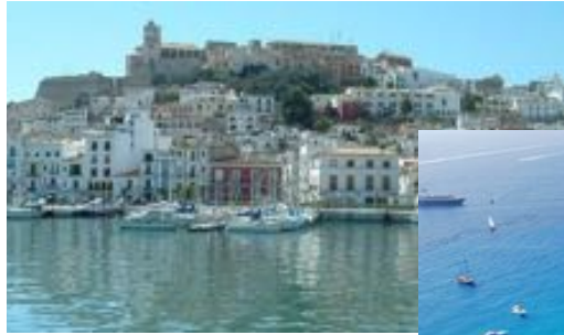
Ibiza y Formentera