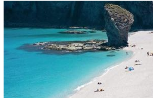
Cabo de Gata

Navega en un nuevo HANSE 505 (2017), galardonado como barco del año en numerosos países. Yate de crucero perfecto, rápido y seguro para navegar con cualquier tiempo. Nuestro patrón profesional se adaptará a tus preferencias, solo actuará bajo tu demanda y comodidad, ,ofreciendo perfeccionar tus técnicas de navegación a vela. Camarote de acceso independiente para el patrón en proa evitando romper la intimidad. Prueba la libertad de navegar con tripulación aún teniendo tu titulación, libertad de fondeos, relax,... Navegamos en Ibiza y Formentera (CN de Ibiza) de junio a octubre. Y en Aguilas (Juan Montiel), Garrucha, Cabo de Gata de noviembre a mayo.